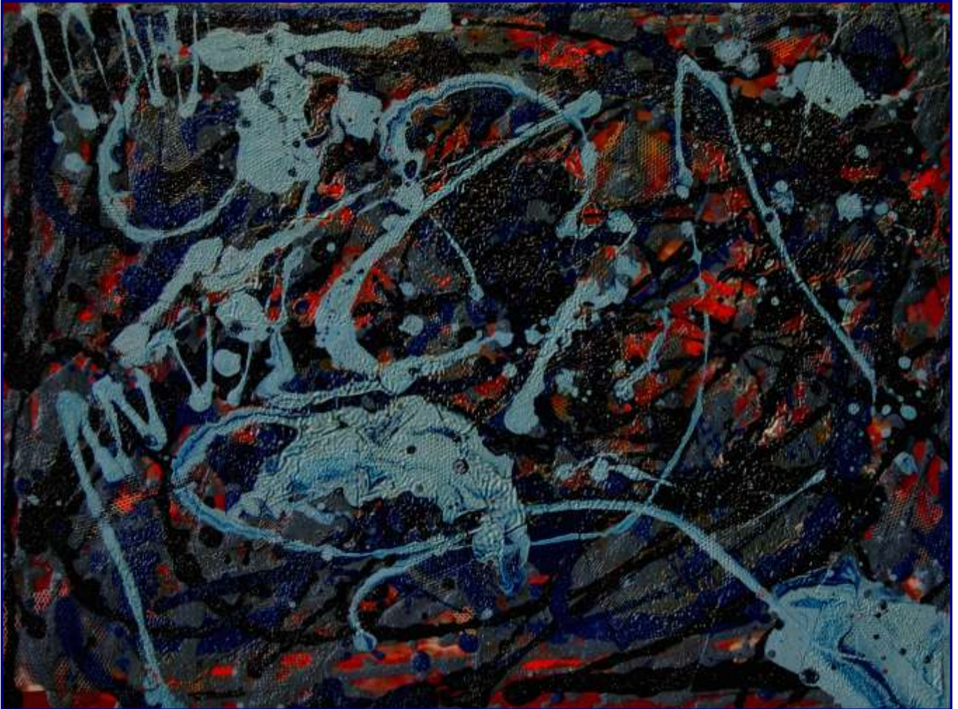
Opera 1810 - Ascoltando: “Vedi! Le fosche notturne spoglie” dal Trovatore di Verdi Olio e materiali vari su tavola 30x40 - Febbraio 2010