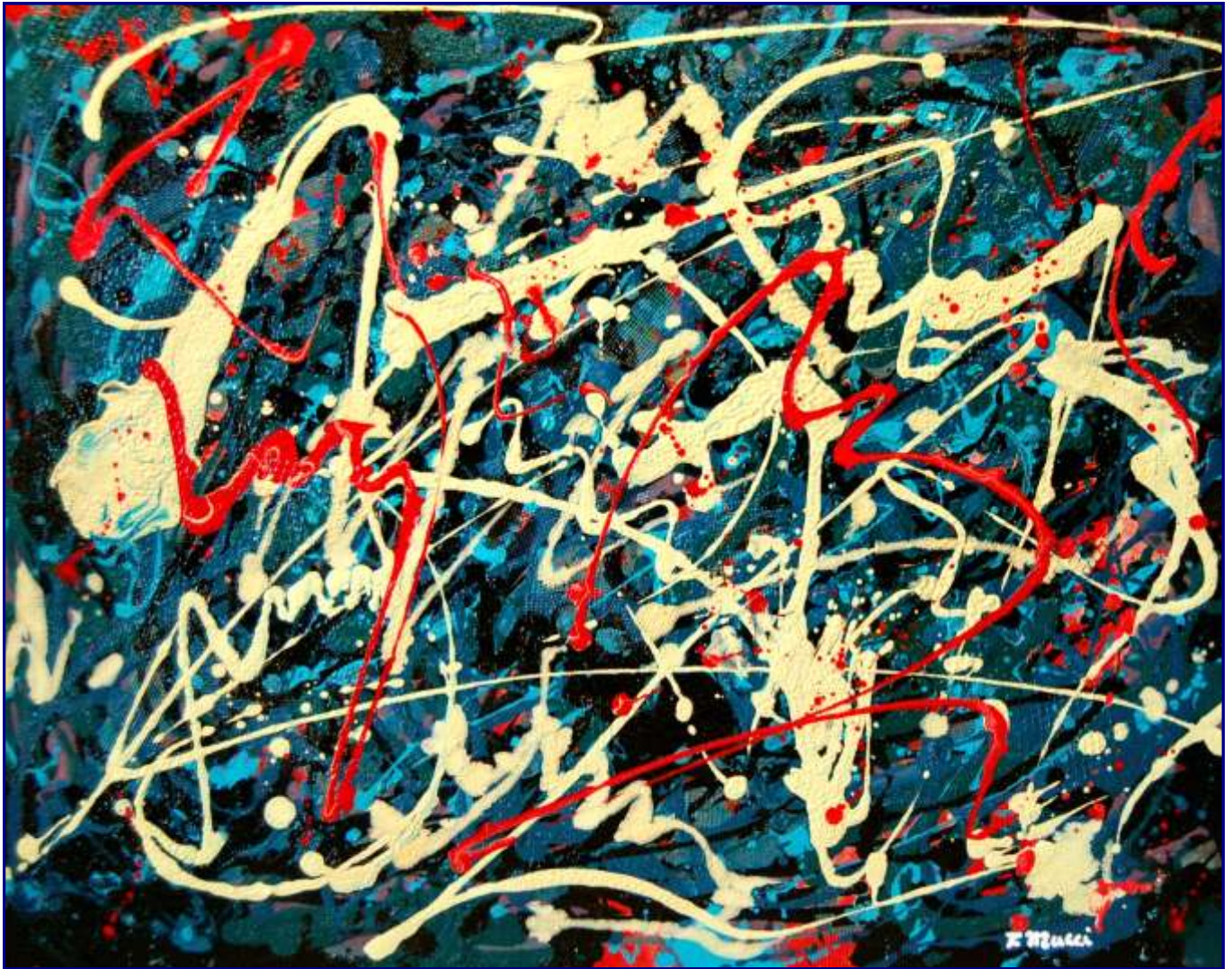
Opera 2010 - Ascoltando: “Vendetta, tremenda vendetta” dal Rigoletto di Verdi Olio e materiali vari su tavola 40x50 - Febbraio 2010