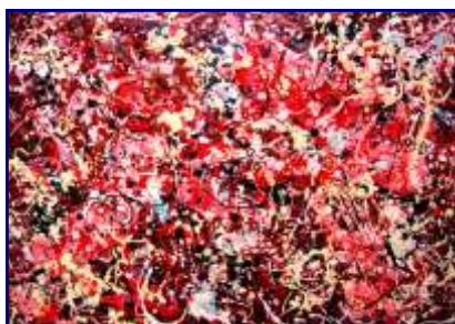
In copertina: Opera 6610 - Voglia di rosso Olio e materiali vari su tela 70x100 Ottobre 2010