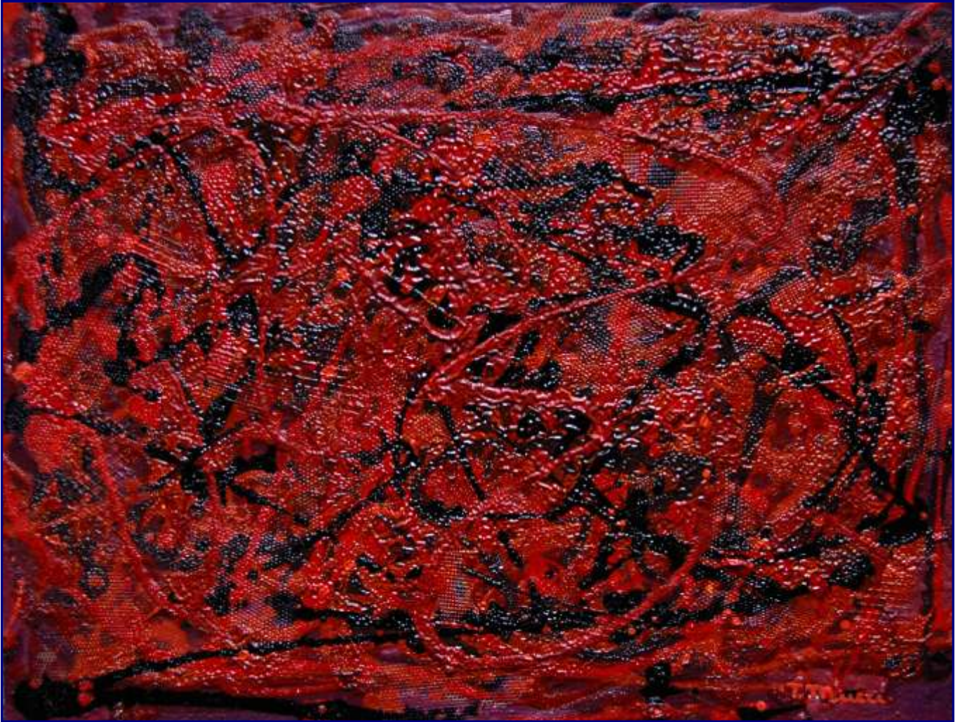
Opera 1710 - Ascoltando: “Come un bel dì di maggio” dall’Andrea Chenier di Giordano Olio e materiali vari su tavola 30x40 - Marzo 2010