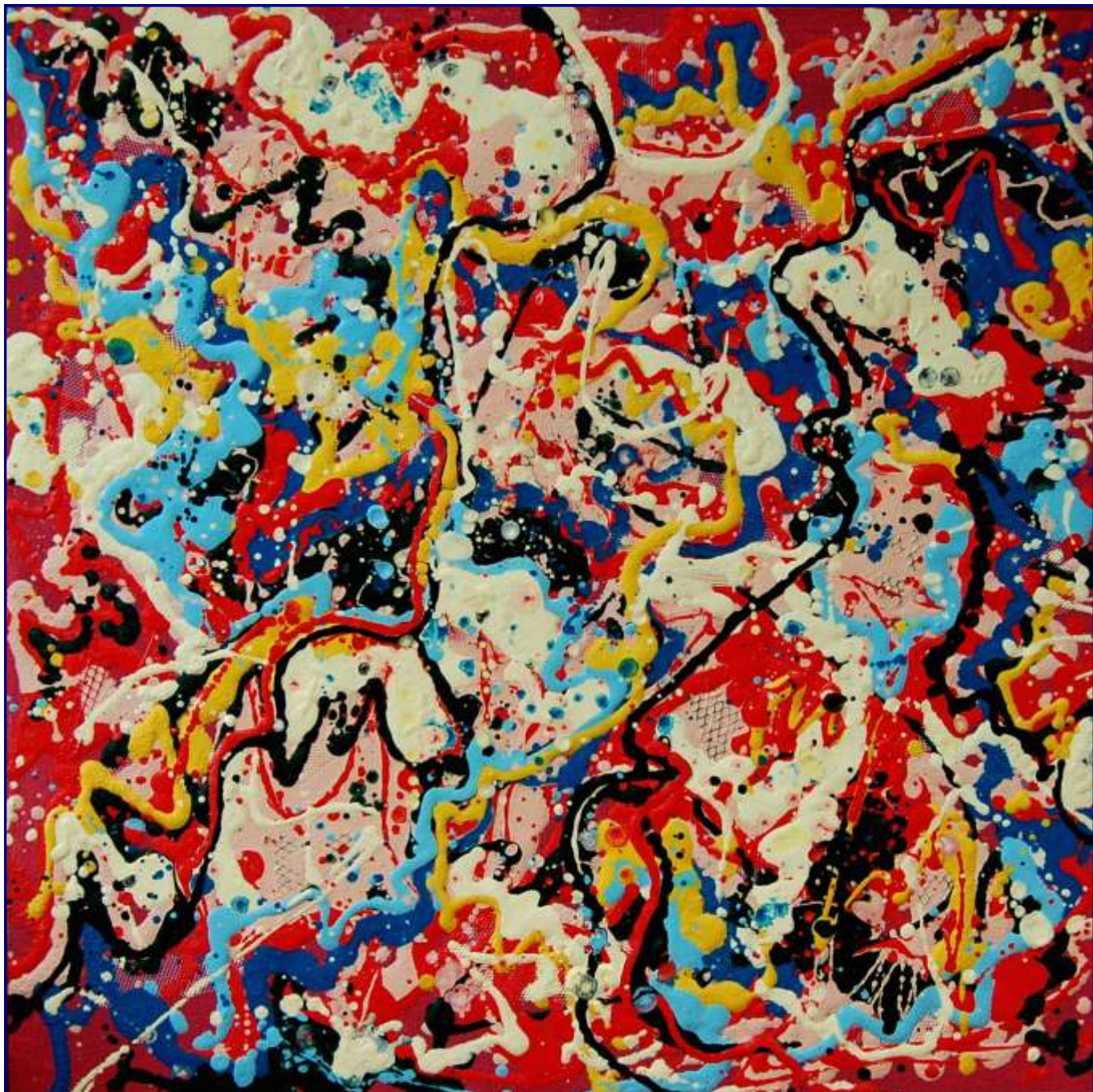
Opera 5310 - Aria serena al parco giochi

Olio e materiali vari su tavola 50x50 - Agosto 2010