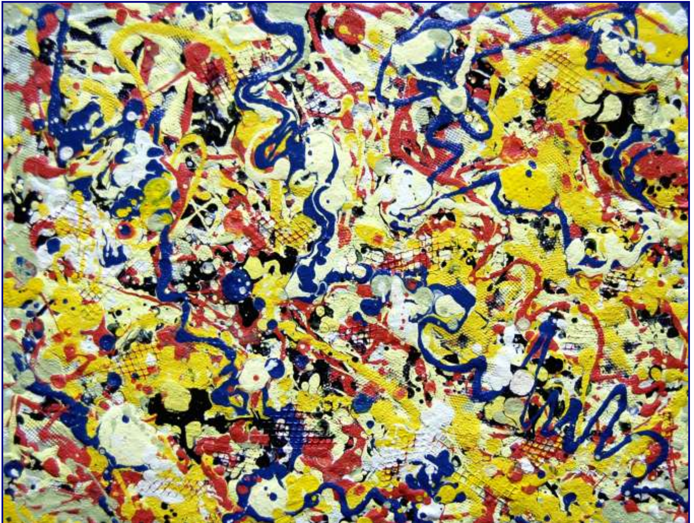
Opera 5810 - Chiacchiere in una giornata serena Olio e materiali vari su tavola 30x40 - Settembre 2010