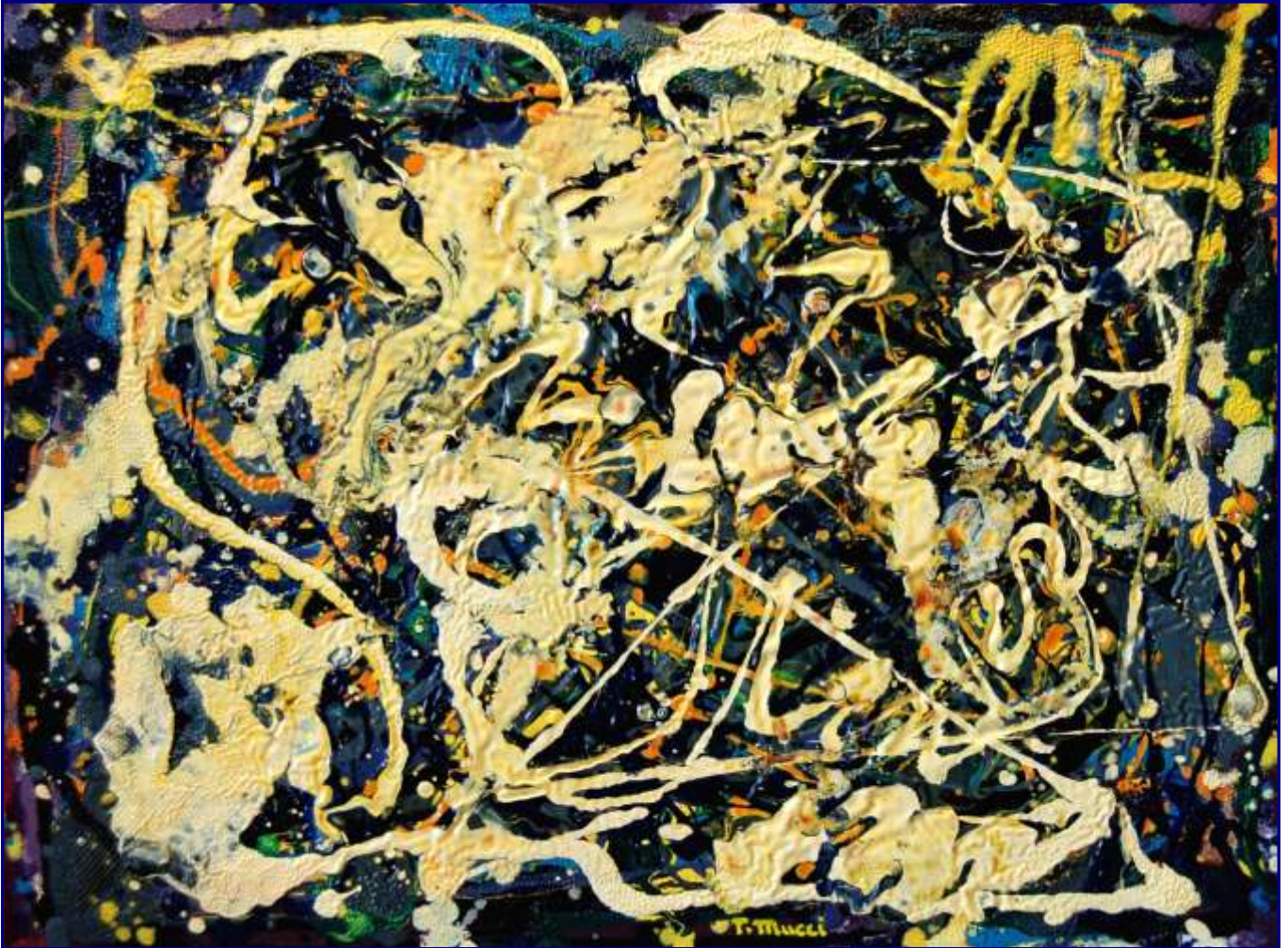
Opera 1910 - Ascoltando: “Il lago dei cigni” di Ciaikovski Olio e materiali vari su tavola 30x40 - Febbraio 2010