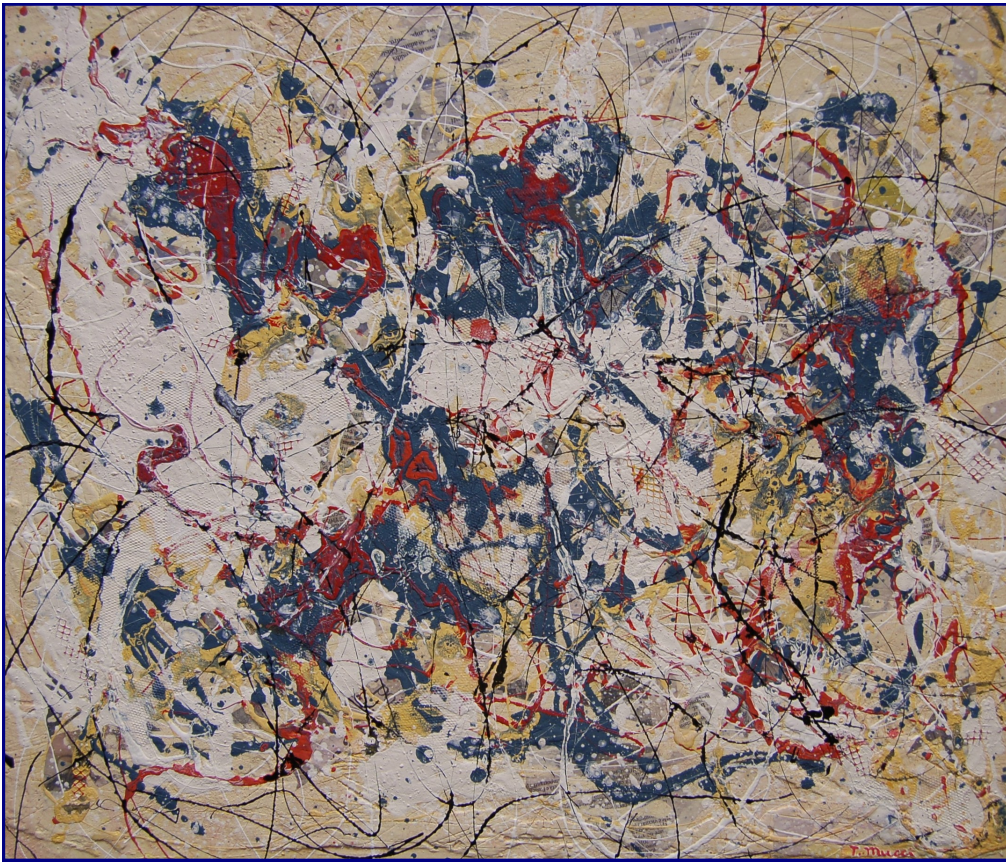
Ogni giorno nell'arena - Tecnica mista, olio e materiali vari su tavola 50x60 - Marzo 2011

Progetti di caos per nuovi universi: ecco cosa sono per me le splendide opere del carissimo Tito Mucci."