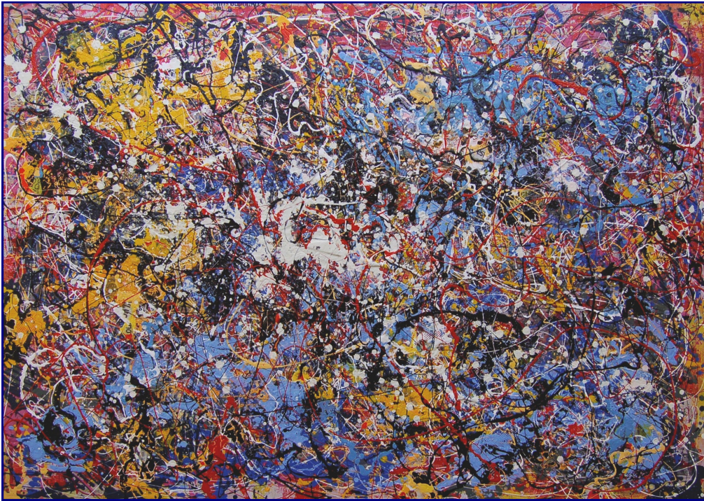
Del mio disprezzo - Tecnica mista, olio e materiali vari su tavola 100x140 - Agosto 2011

.....Sono rimasto impressionato da questo suo processo di maturazione artistica che in poco tempo l'ha proiettato in un astrattismo interessante, originale, maturo e ricco di contenuti. Vedo che ha interpretato al meglio il mio pensiero, dando un'impronta personale alla sua pittura. I suoi dipinti sono coraggiosi e molto belli, e si collocano tra le avanguardie artistiche dei primi del novecento e la nuova astrazione. Complimenti