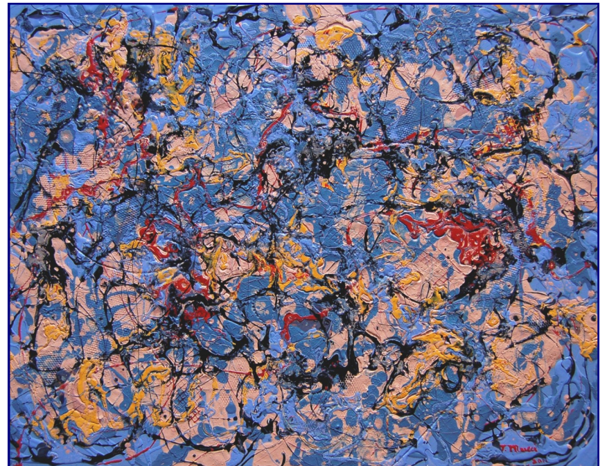
Danza la vita tua - Tecnica mista, olio e materiali vari su tavola 35x45 - Marzo 2011