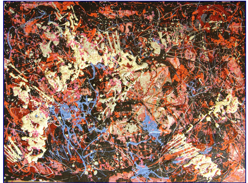
Nella mia malinconia - Tecnica mista, olio e materiali vari su tavola 60x80 - Agosto 2011