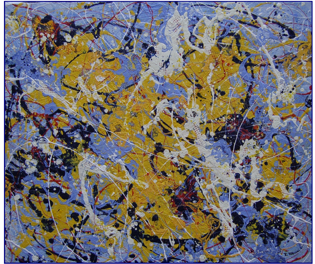
La scala del giorno - Tecnica mista, olio e materiali vari su tavola 50x60 - Marzo 2011