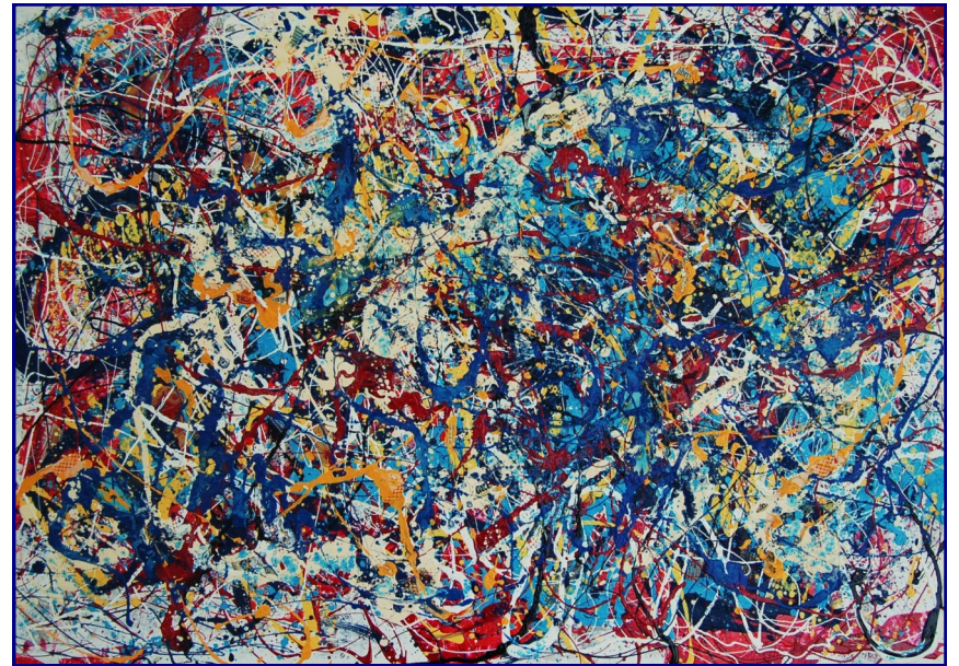
Il percorso della vita - Tecnica mista, olio e materiali vari su tela 70x100 - Giugno 2011