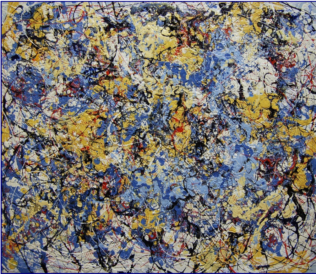
Pensieri liberi - Tecnica mista, olio e materiali vari su tavola 60x70 - Aprile 2011

Le opere che il maestro ha esposto, un intreccio di linee, colori e disegni, tutto bene armonizzato, mi trasmettano veramente un moto di gioia, di serenità, di letizia. Un'armonia dello spirito.