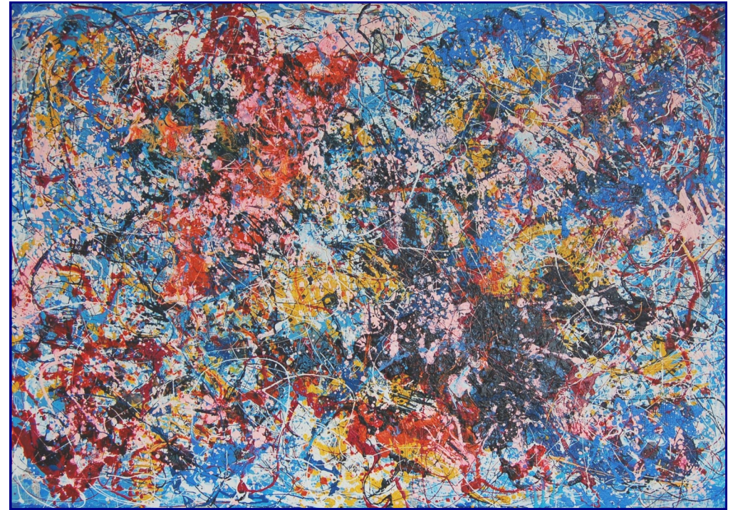
Ciò che non ti ho detto - Tecnica mista, olio e materiali vari su tavola 100x140 - Luglio 2011

Il mio cammino - Tecnica mista, olio e materiali vari su tavola 100x140 - Agosto 2011