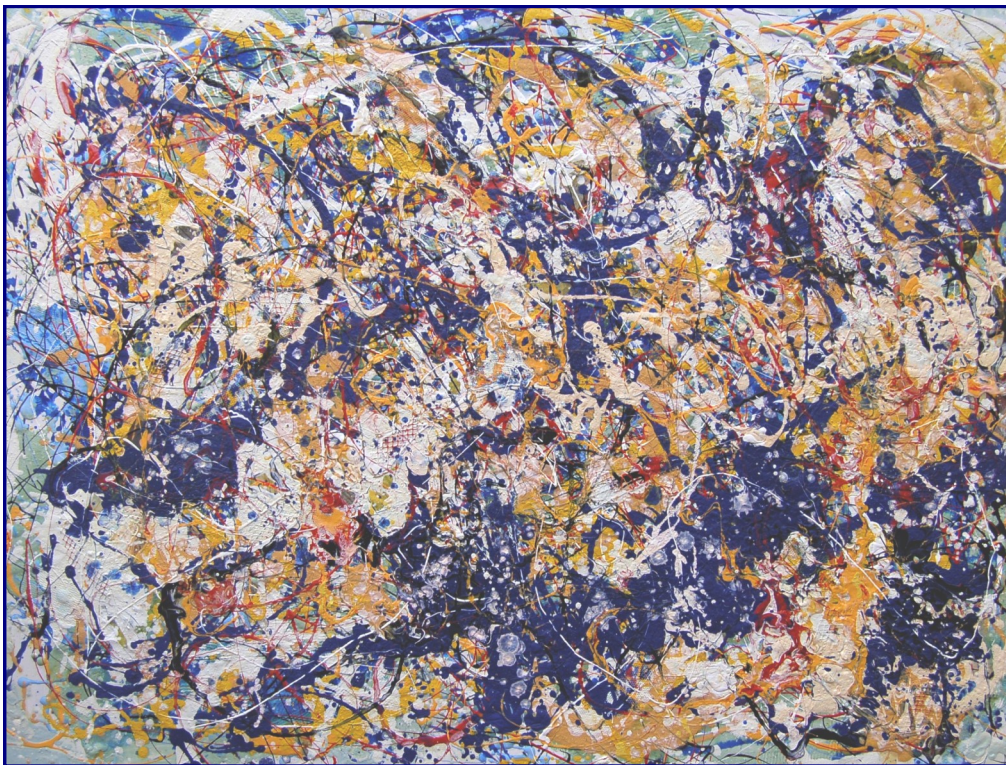
Nel mio mondo - Tecnica mista, olio e materiali vari su tavola 60x80 - Luglio 2011