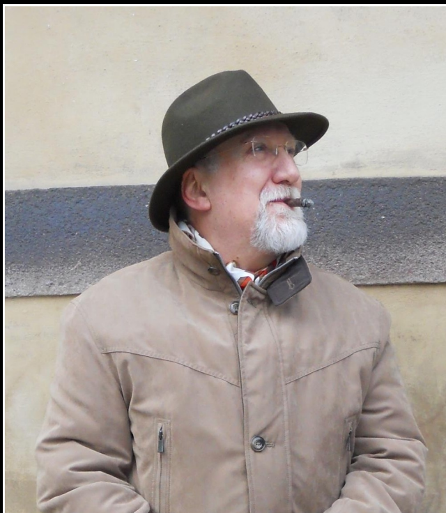
L'artista in una foto di Marco Palamidessi del dicembre 2010